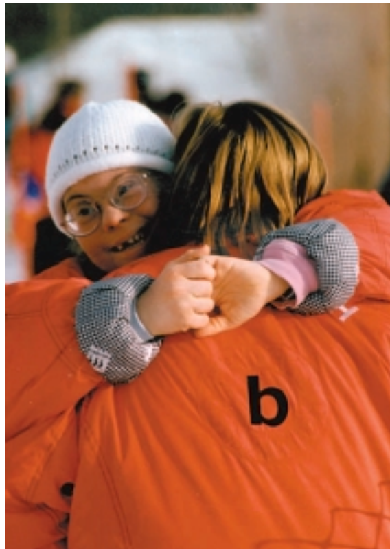
◀ Freude im Sport – ein Bild sagt mehr als tausend Worte.

Es entsteht eine interne Hierarchie einer Mannschaft, die eine Gruppendynamik ergibt. Diese führt dann zum Erfolg, wenn der Trainer sie positiv zu nützen weiß. Dabei spielt die Identifikation mit der Gruppe eine große Rolle. Sie ermöglicht ein Gemeinschaftserleben und die Erweiterung der Perspektiven des Einzelnen. Ein negativer Verlauf führt zu Streit und Mobbing. Sportlicher Erfolg kann dadurch unmöglich gemacht werden. Konditionelle und technische Aspekte verlieren dabei an Bedeutung.